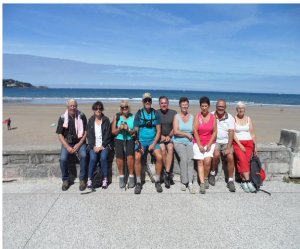
Les marcheurs à Hendaye,

Nous vous invitons à nous rejoindre, toutes les nouvelles recrues seront accueillies avec grand plaisir.