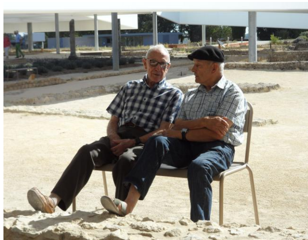
C'est ça aussi le Club !! Refaire le monde à deux